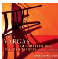
Fred Vargas Im Schatten des Palazzo Farnese Lesung Sprecherin: Suzanne von Borsody

Drei französische Studenten – sie nennen sich nach den römischen Kaisern Claudius, Tiberius und Nero – leben in Rom. Als Claudius' Vater, ein Kunsthistoriker, seinen Besuch ankündigt, ist Claudius verwundert. Will er ihn ermahnen, seine Studien ernsthafter zu betreiben? Oder kommt er wegen Zeichnungen aus der vatikanischen Bibliothek? Doch der Vater wird umgebracht. Die drei «Kaiser», ein italienischer Inspektor und ein französischer Sonderbeauftragter ermitteln.