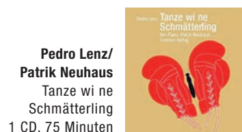
Pedro Lenz/ Patrik Neuhaus Tanze wi ne Schmäterling 1 CD, 75 Minuten