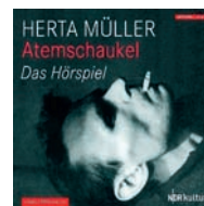
Herta Müller Atemschaukel Hörspiel Diverse Sprechende

Siebenbürgen nach dem Zweiten Weltkrieg: Auf Stalins Geheiss werden arbeitsfähige Männer und Frauen deutscher Herkunft in Lager nach Russland deportiert. Der 17-jährige Leopold ist einer von ihnen. Die Grossmutter sagt beim Abschied: «Ich weiss, du kommst wieder.» Dieser Satz stärkt ihn im Kampf gegen den Hungerengel, Kälte, Entsetzen und Heimweh. Nach fünf Jahren kehrt er tatsächlich zurück. Dicht.